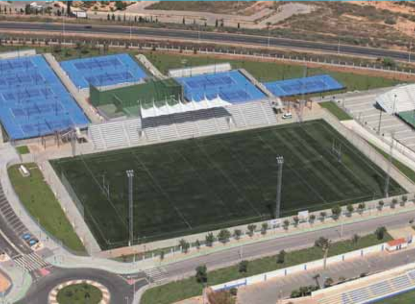
Estadio Nelson Mandela