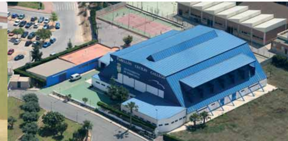
Complejo deportivo Cecilio Gallego