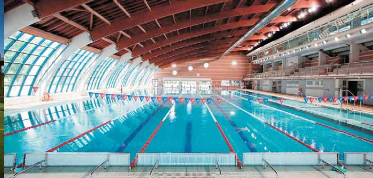
Piscina Olímpica Climatizada