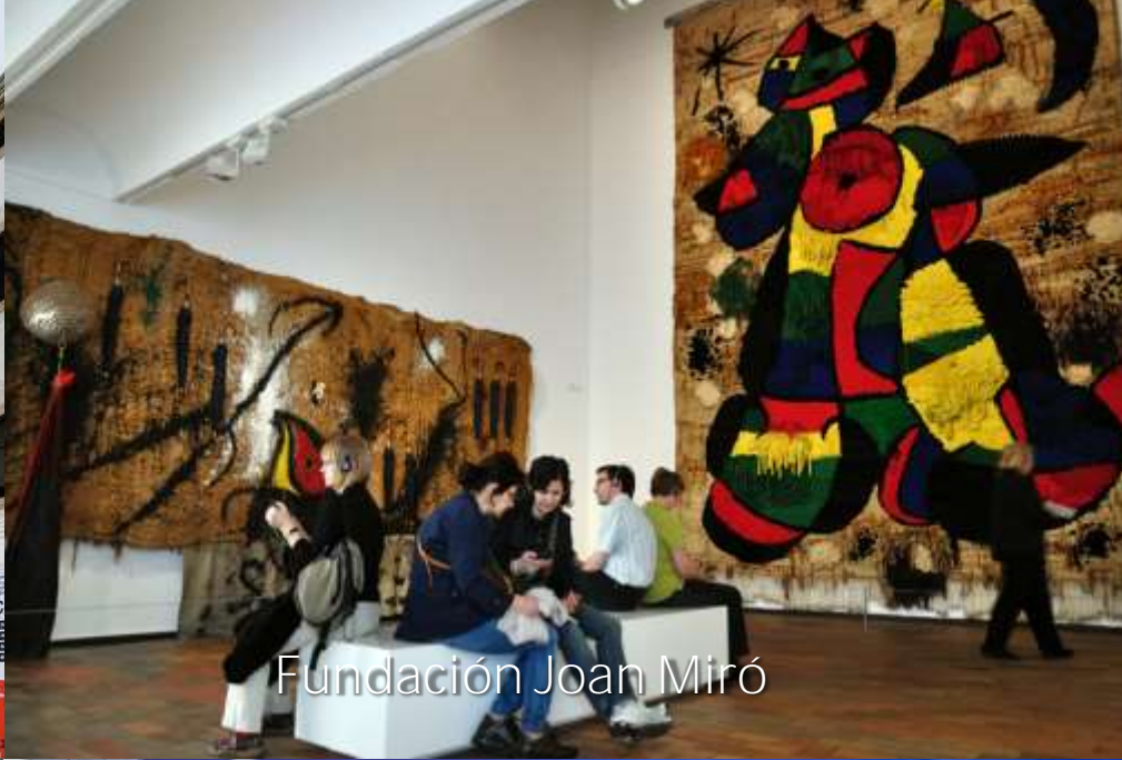
Fundación Joan Miró