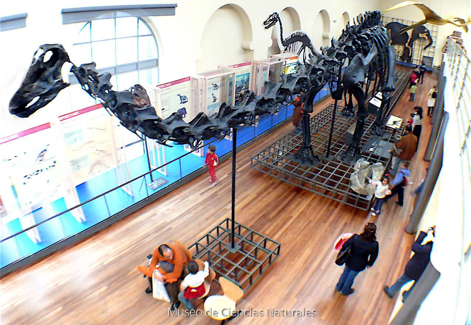
Museo de Ciencias Naturales