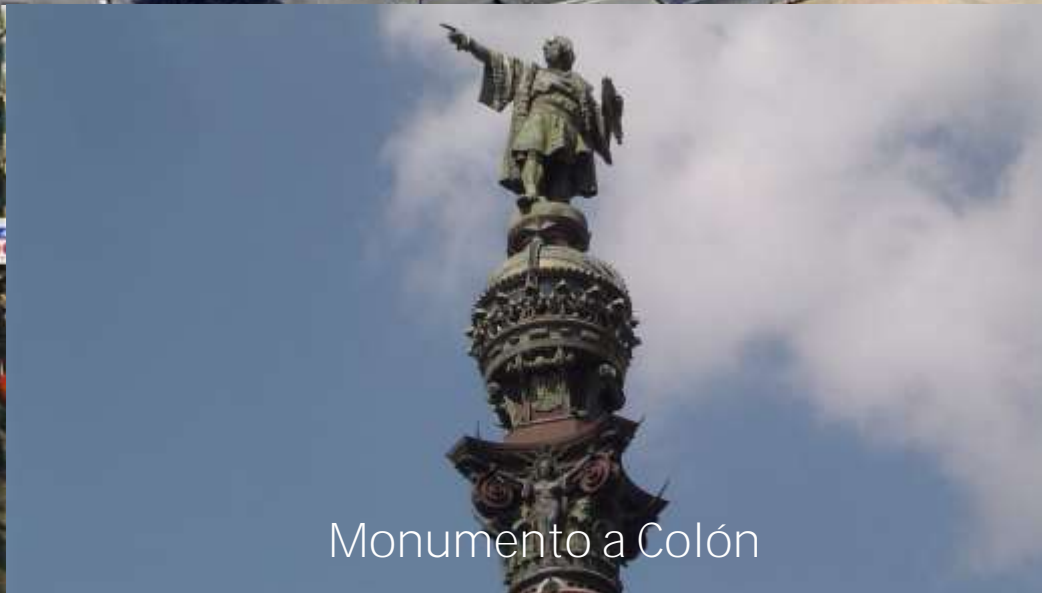
Monumento a Colón