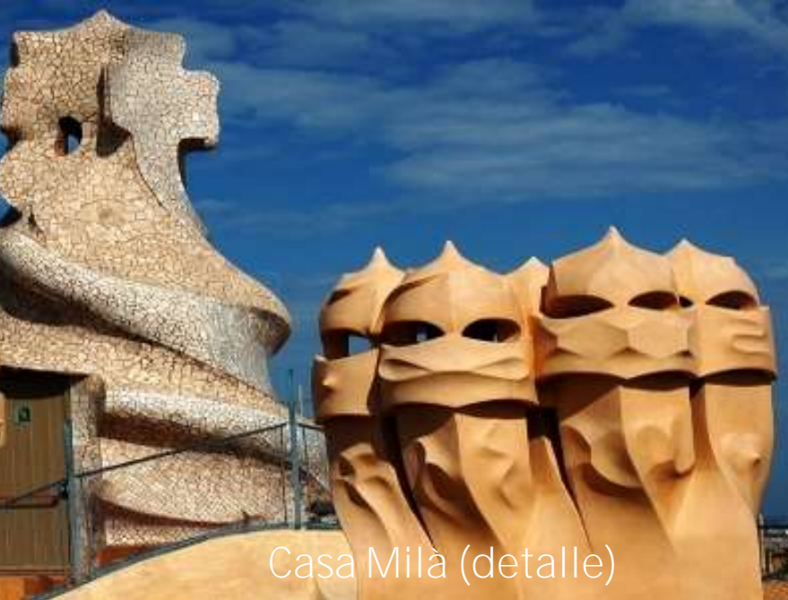
Casa Milà (detalle)