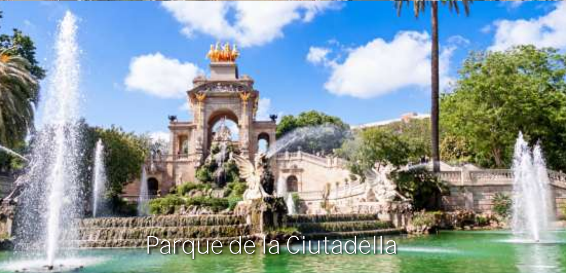
Parque de la Ciutadella