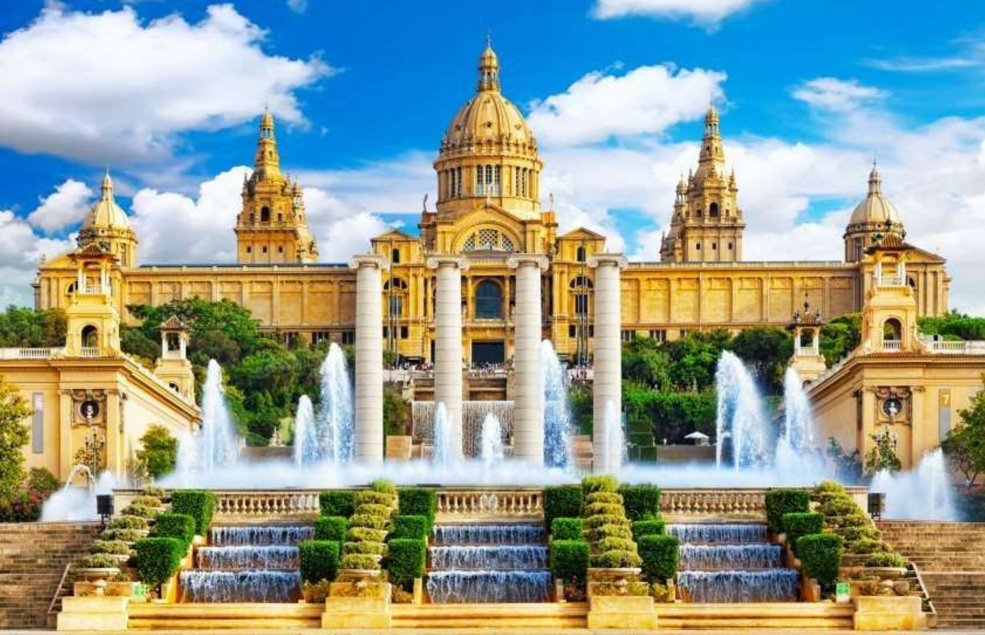
Museo de Arte de Cataluña