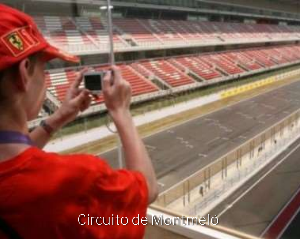
Circuito de Montmeló