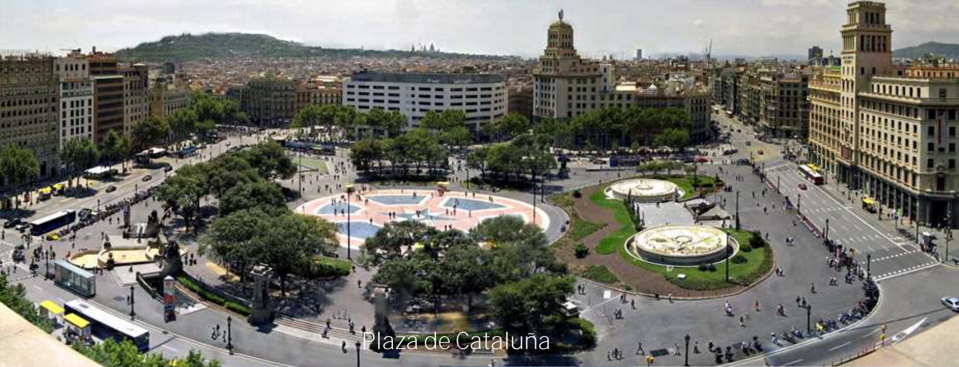
Plaza de Catalunya