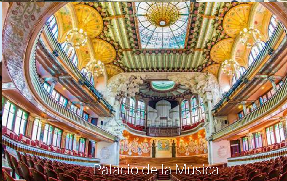
Palacio de la Música