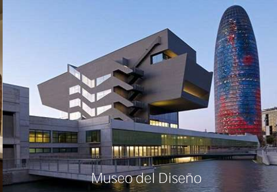
Museo del Diseño