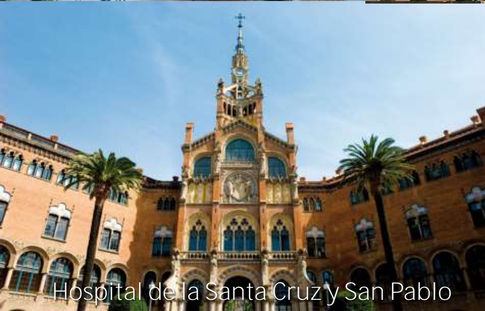
Hospital de la Santa Cruz y San Pablo