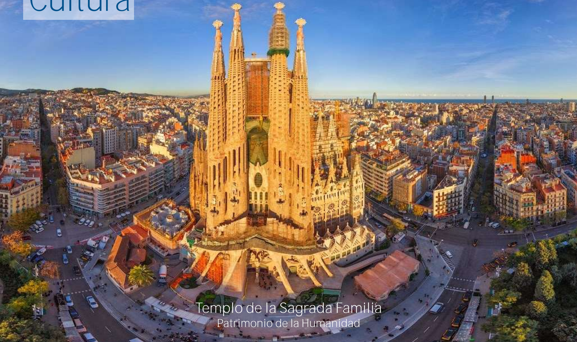
Templo de la Sagrada Familia Patrimonio de la Humanidad