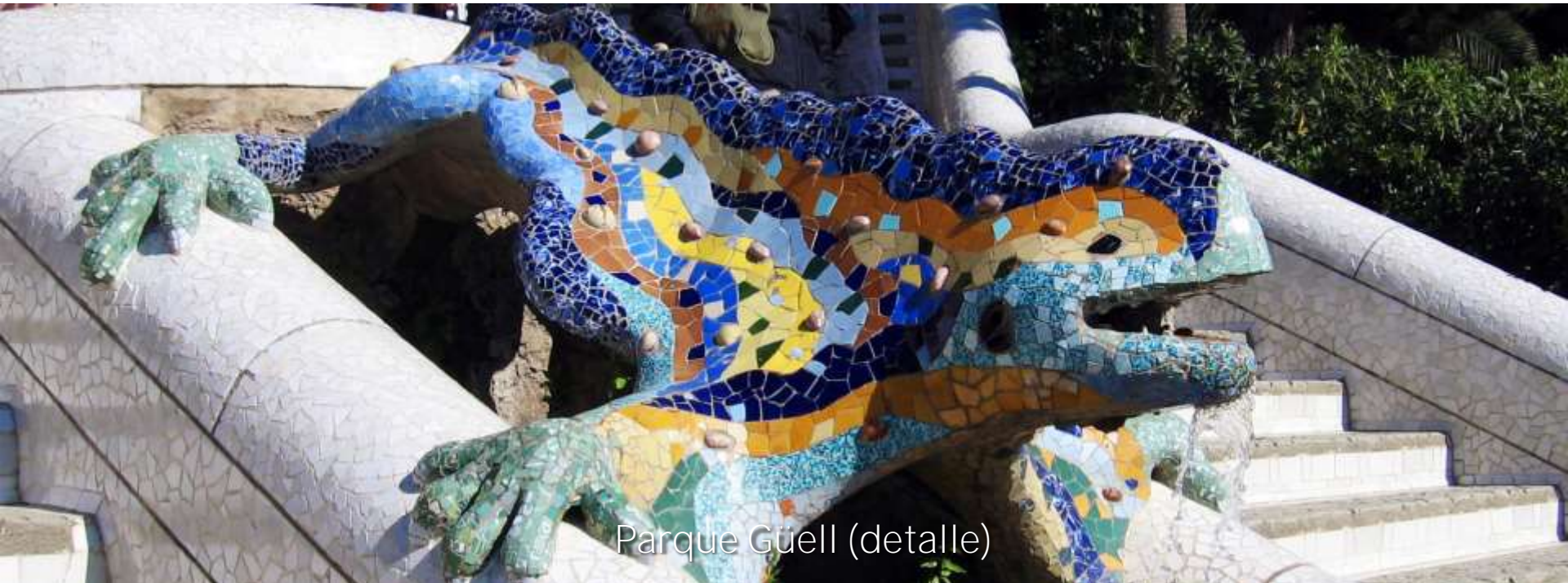
Parque Güell (detalle)

A su obra debemos añadir una excepcional apuesta por todo lo que represente el futuro, desde el arte de vanguardia hasta el diseño en cualquiera de sus aspectos. La oferta de actividades deportivas es enorme, así como de ocio, donde Port Aventura constituye uno de los parques temáticos pioneros e innovadores de Europa.