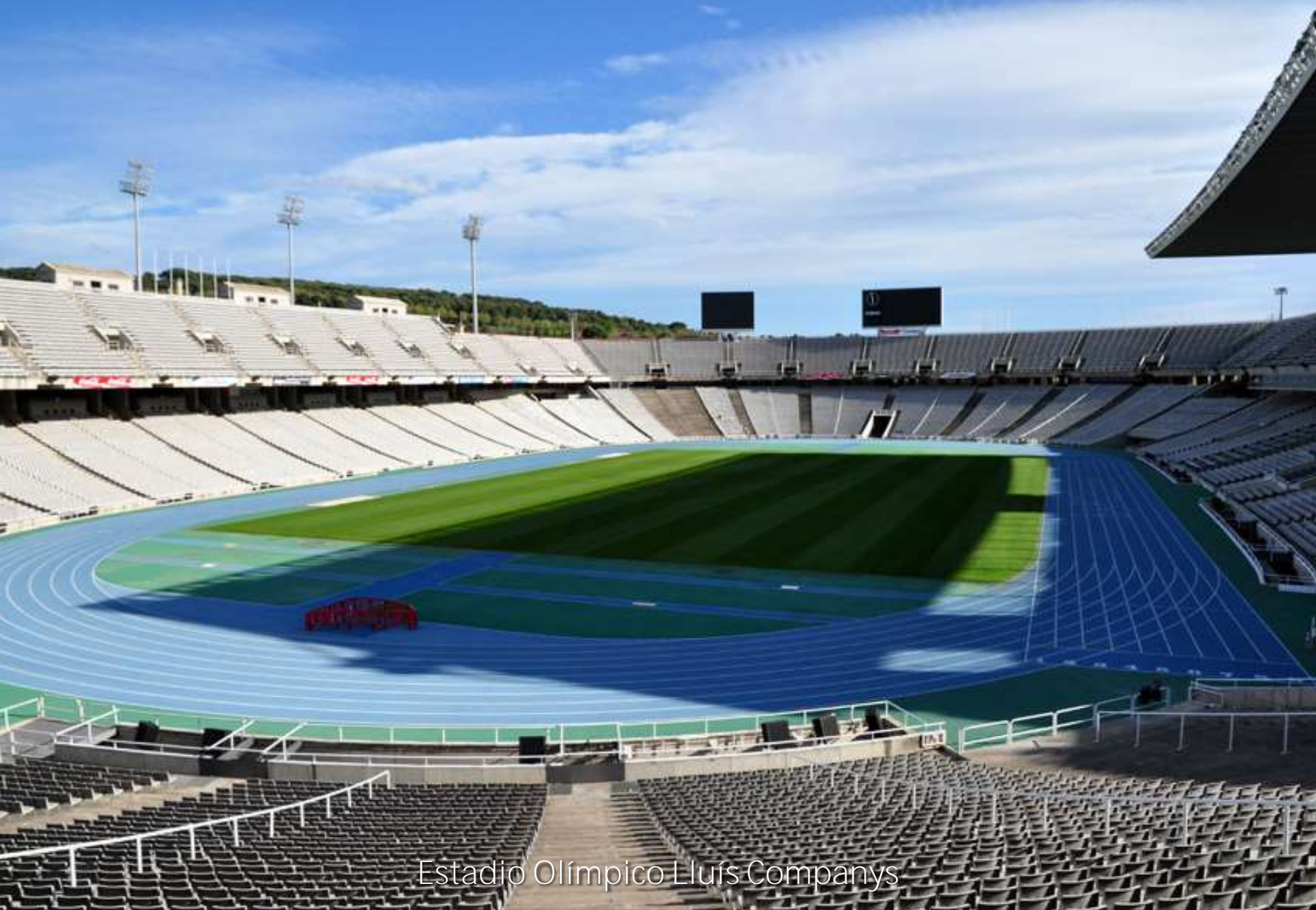
Estadio Olímpico Lluís Companys