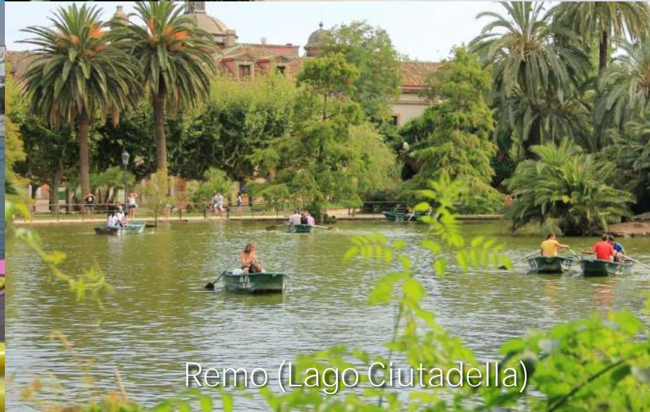
Remo (Lago Ciutadella)