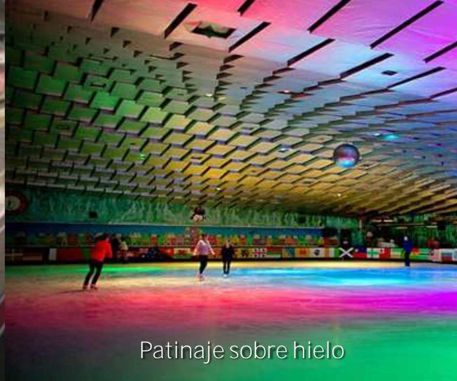
Patinaje sobre hielo