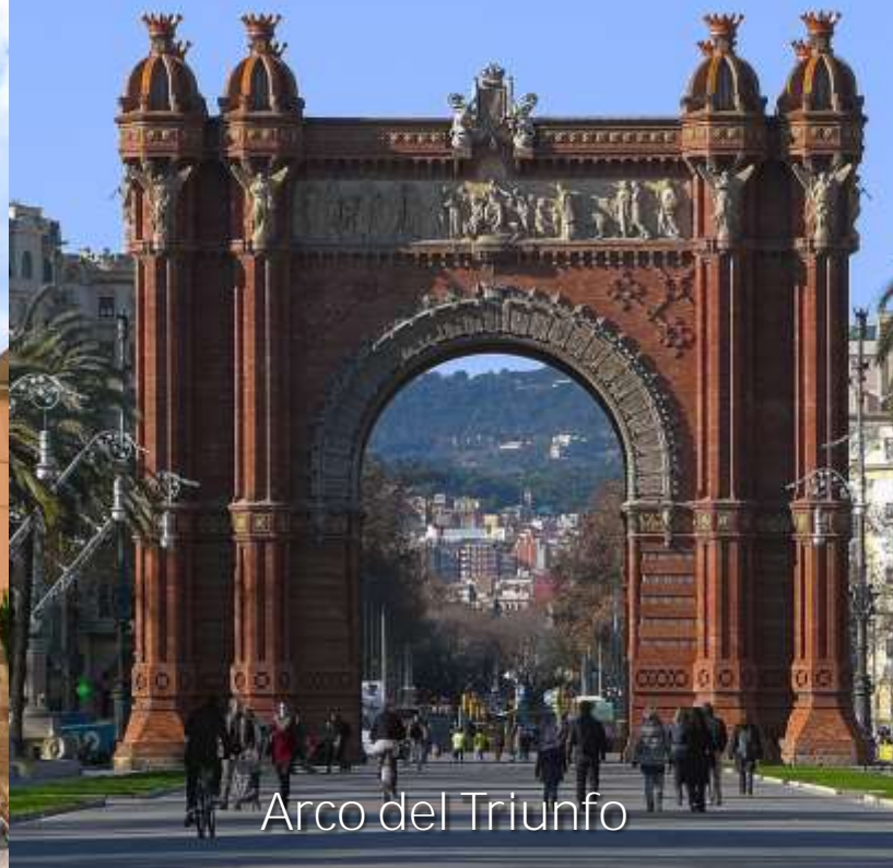
Arco del Triunfo