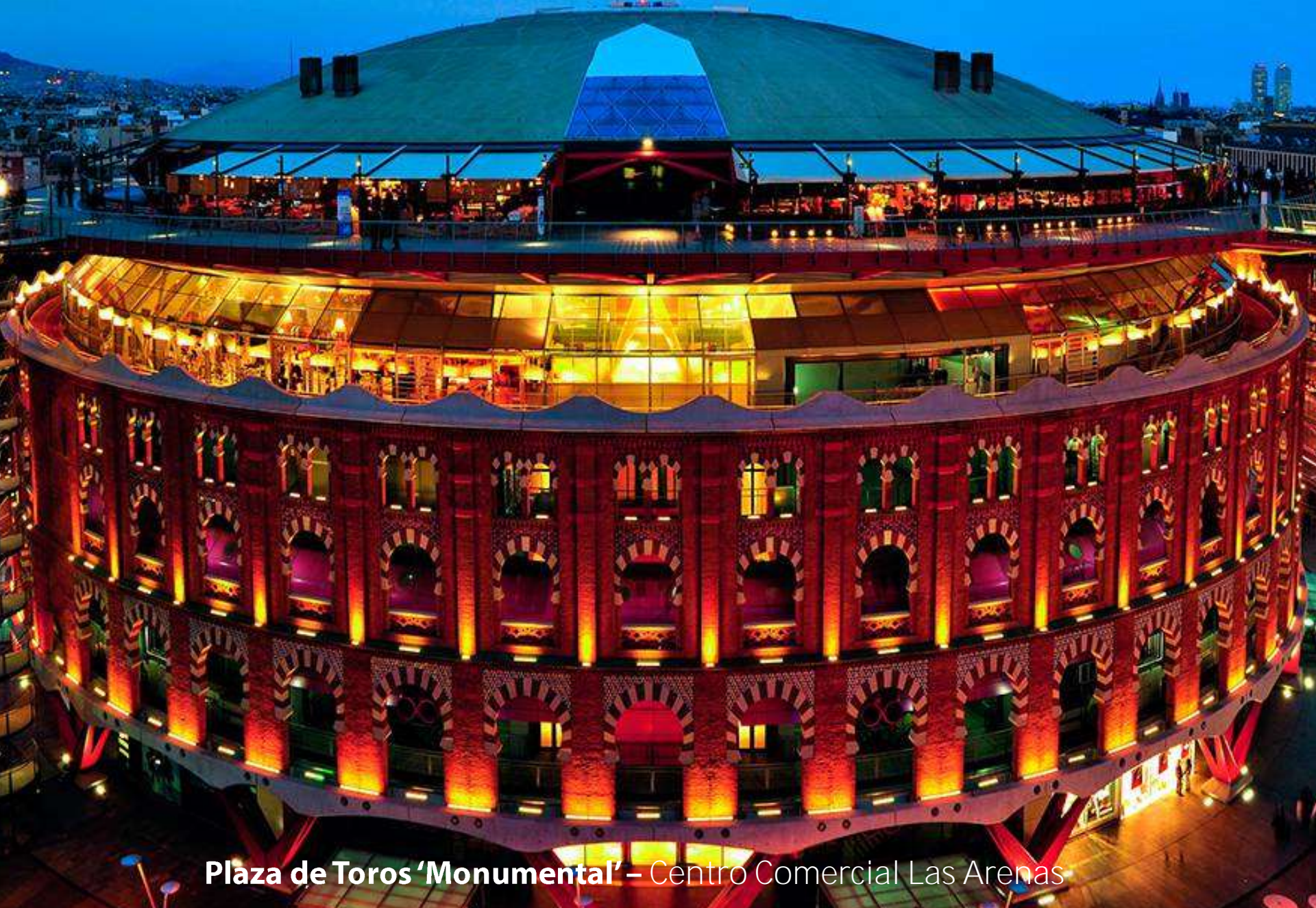
Plaza de Toros 'Monumental' – Centro Comercial Las Arenas