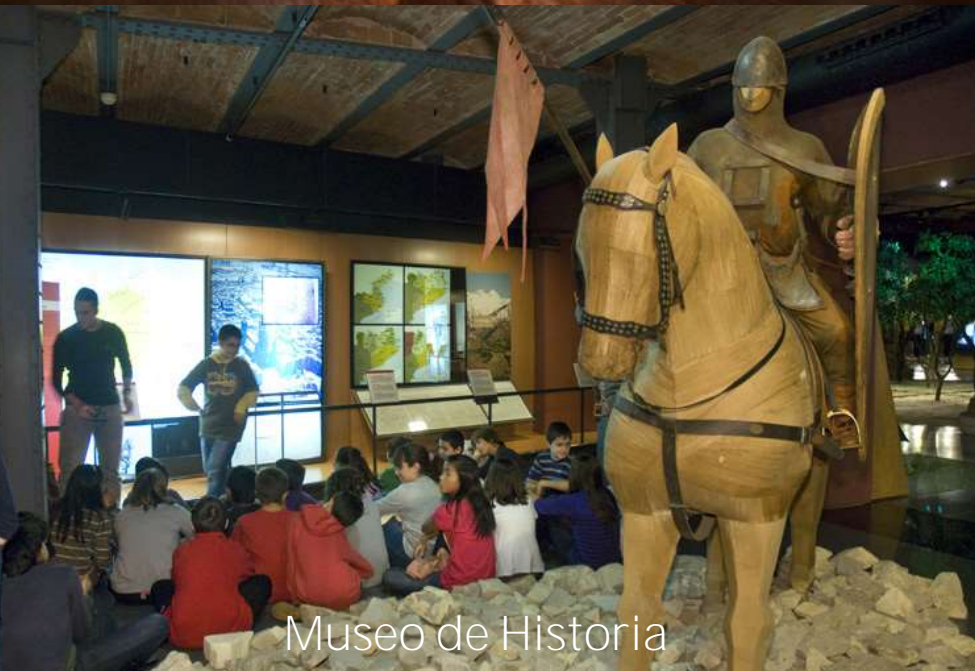
Museo de Historia