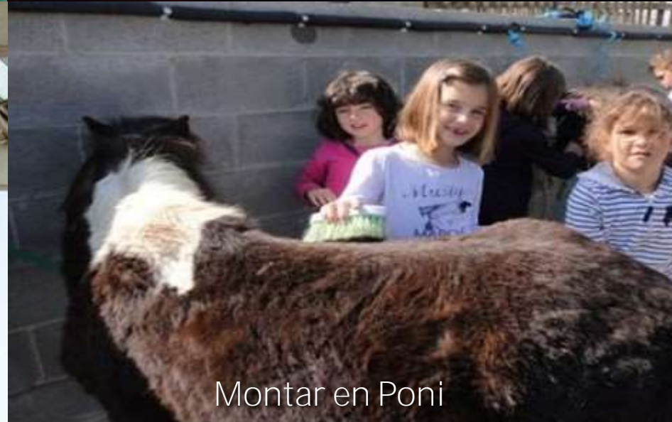
Montar en Poni