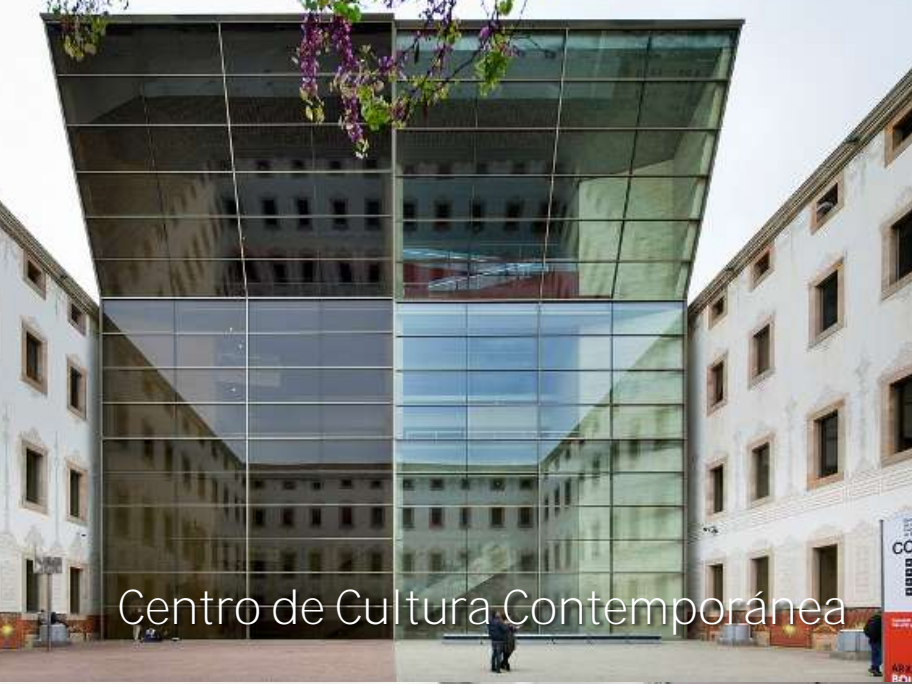
Centro de Cultura Contemporánea