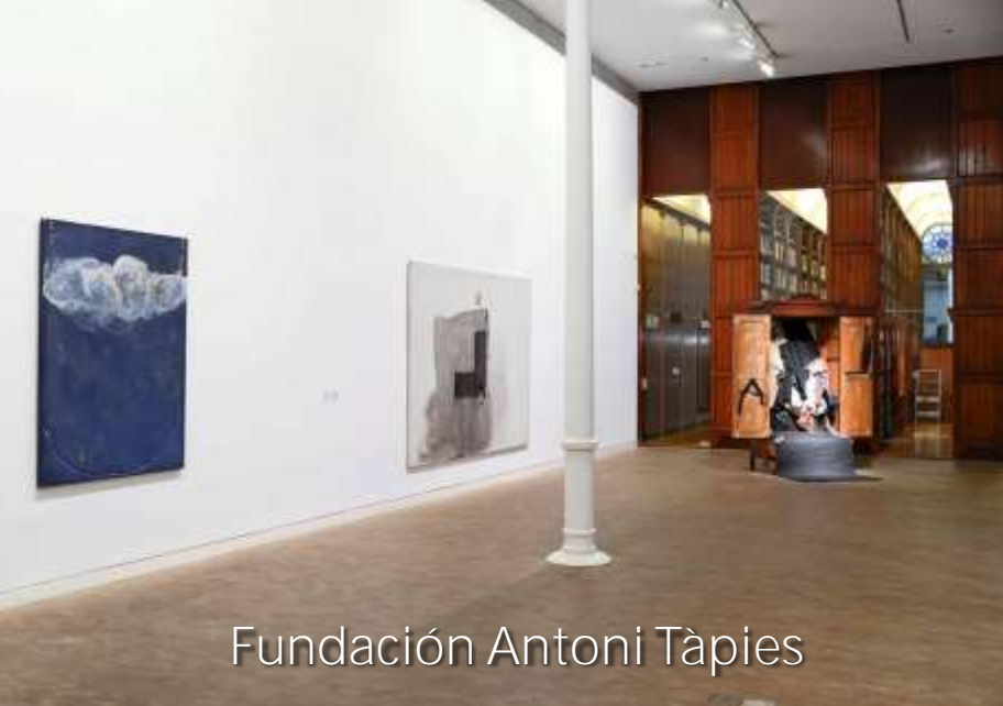
Fundación Antoni Tàpies