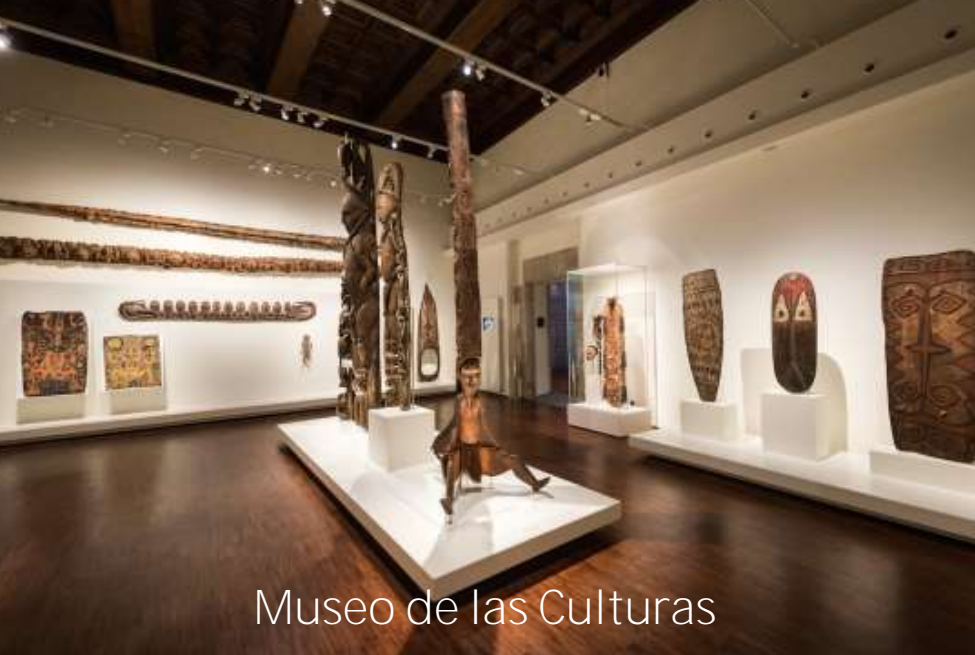
Museo de las Culturas